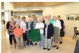
Im Drei Linden

Jeden Montagnachmittag um 13.30 kommen die Jass-begeisterten Mitglieder ins Drei Linden zu einem Jass-Nachmittag. Wir können noch Jasser gebrauchen.