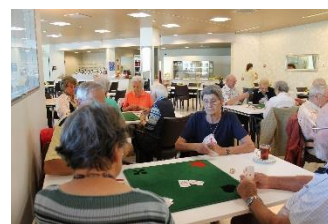
und sehr ernsthaft