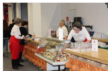
Letzte Muba 8. – 17. Februar 2019