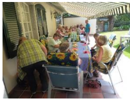
und Grill mit Salatbuffet und Kaffee und Kuchen bei der Waldhütte Oberwil