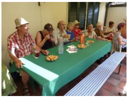
Apero bei Trix

Die Wandergruppe führt jeden 3. Freitag eine ca. 2 stündige leichte Wanderung durch. Am Schluss der Wanderung kehrt die Gruppe zu einem Z'vieri in ein Restaurant ein. Einmal im Jahr gibt es eine Ganztageswanderung, einen Grillplausch bei der Waldhütte Oberwil und eine Niggi-Näggi Wanderung mit Apero im Wald und Fondueessen.