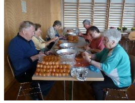
Helfer beim Klöpfer schälen