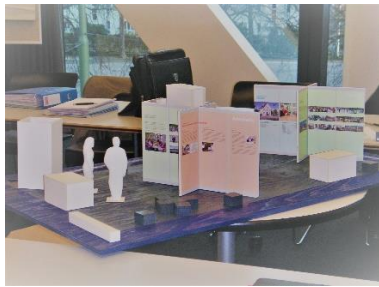
Panels in Miniatur