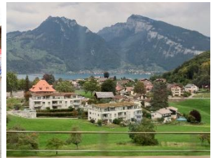
Niggi-Näggi Apero im Wald und Fondueplausch Ganztageswanderung nach Adelboden