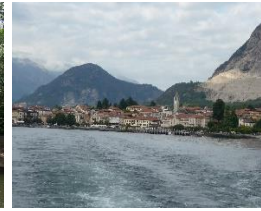
2017 Lago Maggiore